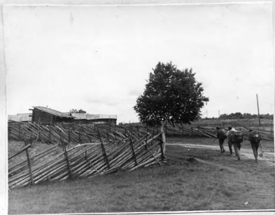
Заборы в дер. Виллама.