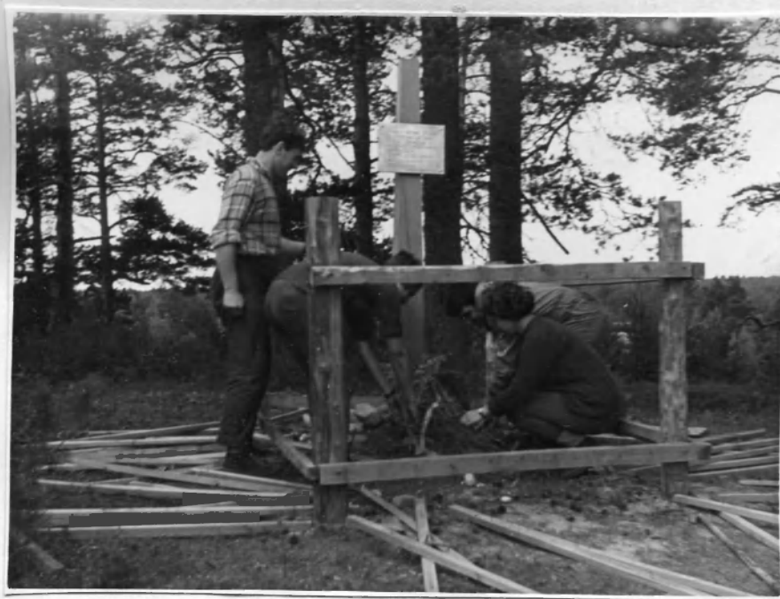
У дер. Нурмолица.