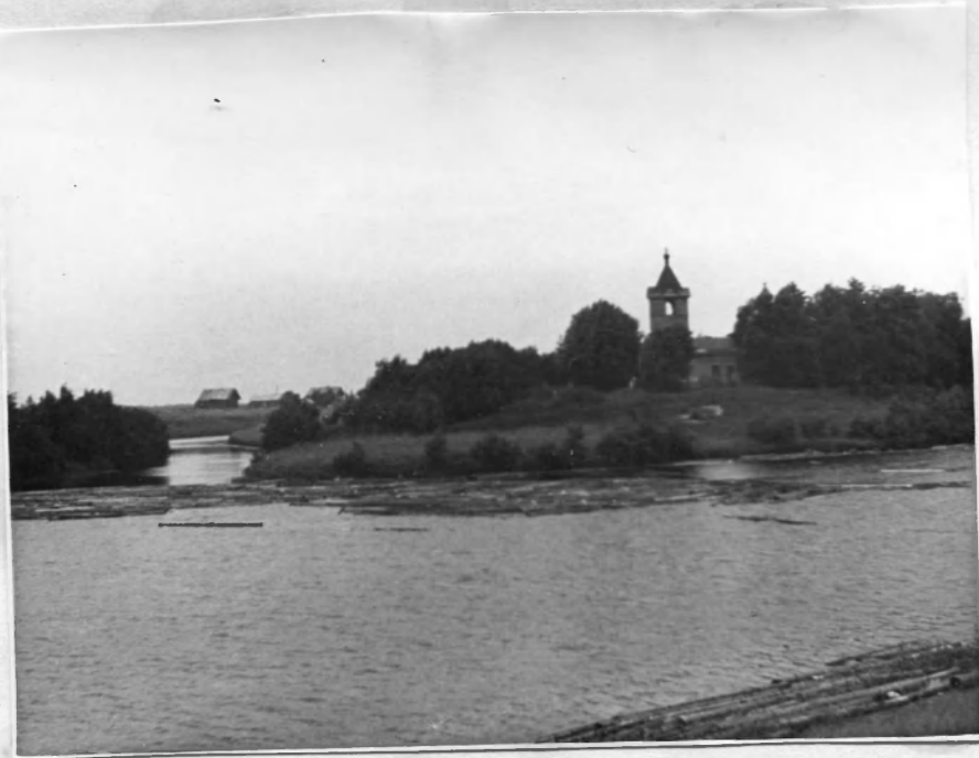
Место впадения р. Тухсы в р. Олонку.