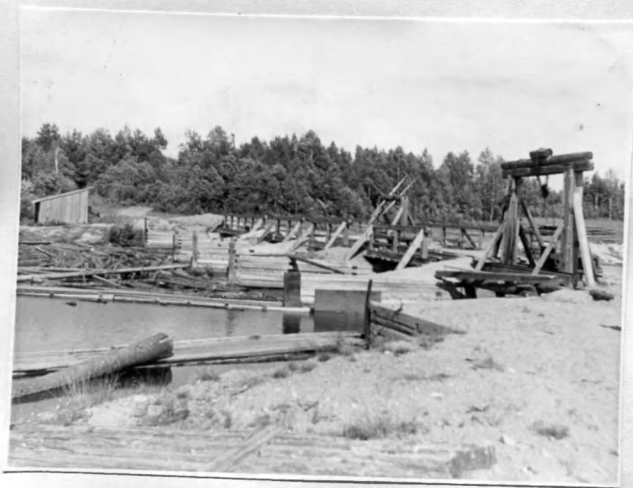
Плотина на р. Олонка