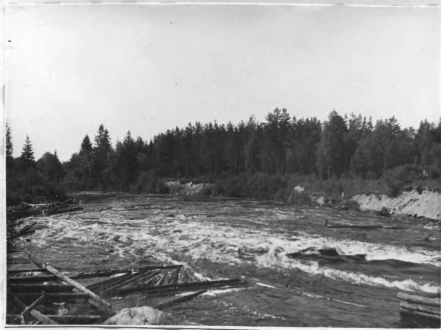
Сплав древесины на р. Олонка.