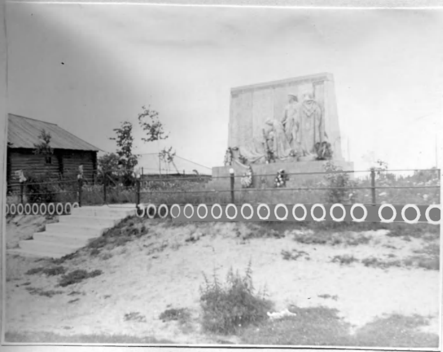
Памятник в г. Лоткозеро.