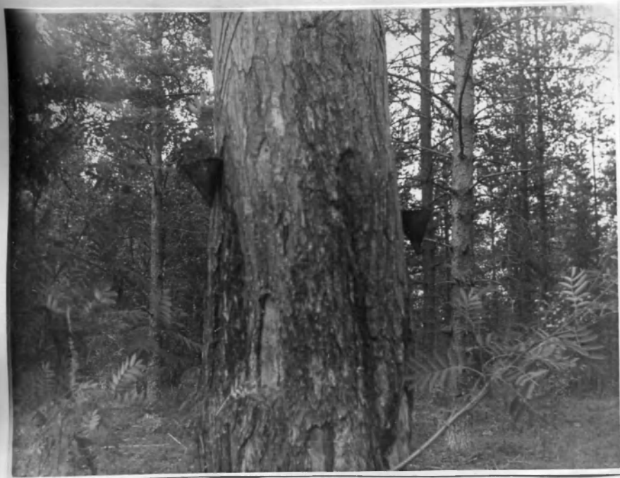
Подготовка леса к вырубке. Сбор смолы.