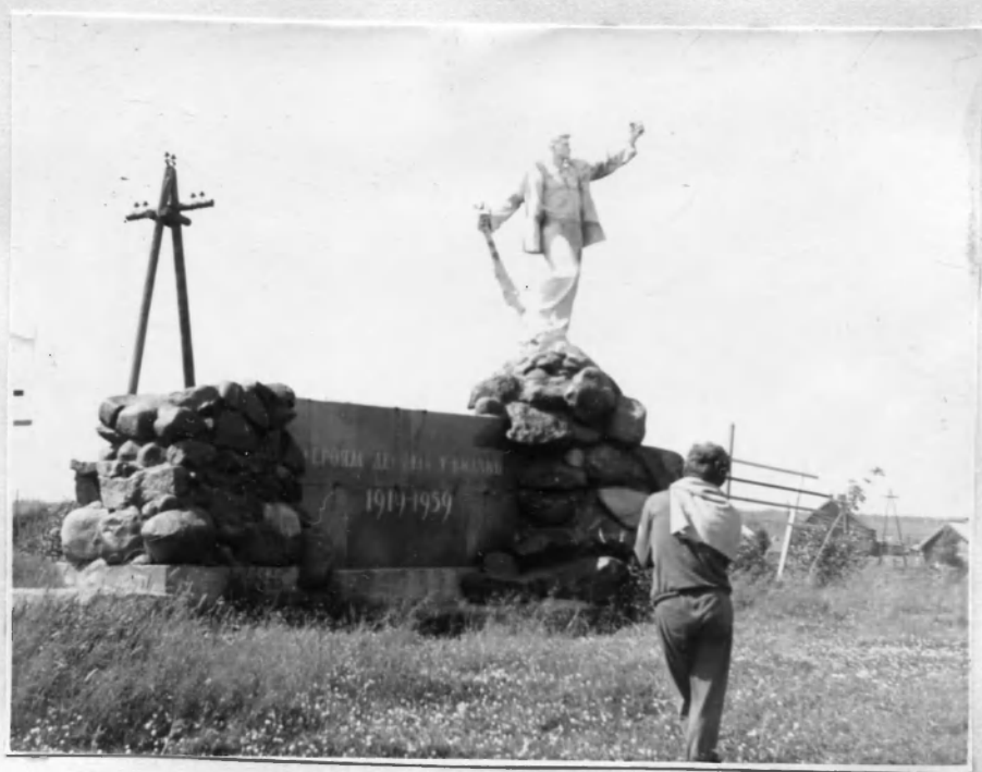
Памятник в дер. Видлица.