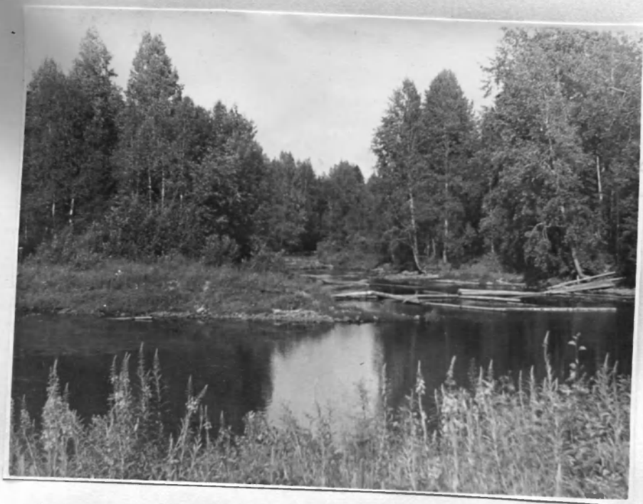
Место впадения р. Ыльки в р. Олонку.