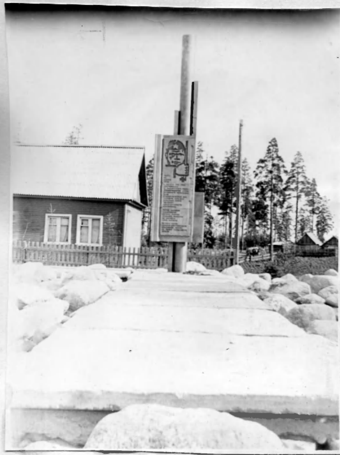
В дер. Сяндеба.